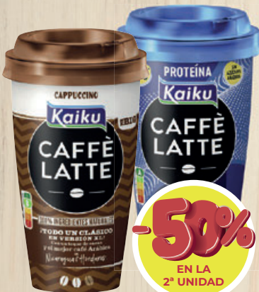
CAFFE LATTE Kaiku Mr. Big, cappuccino, light, proteína o cremoso, 370 ml