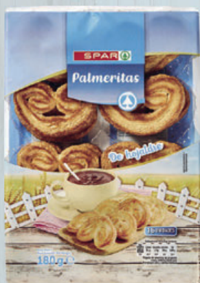
0,95 (0,53 €/100 g) PALMERITAS SPAR, hojaldre, 180 g