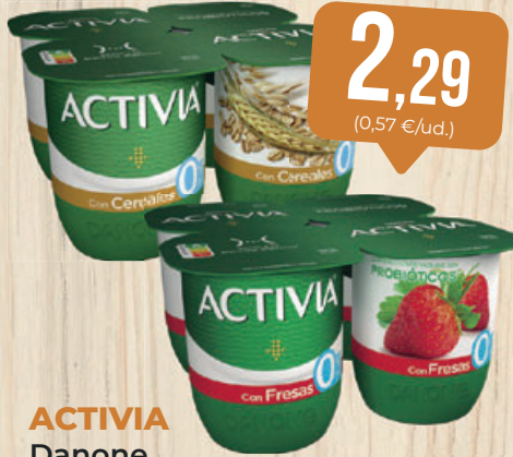
ACTIVIA Danone, desnatado con trozos o cereales, 120 g, pack 4 ud.