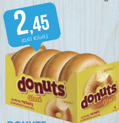
2,45 (0,61 €/ud.) DONUTS glacé, 4 ud.