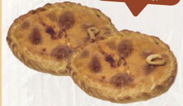
EMPANADA GALLEGA GOURMET atún, carne o pollo con champiñones, 500 g

2 UNIDADES LA UD. CUESTA 0,75 (0,88 €/100 g) 2 unidades 1,50€ 1 ud. 0,99€ (1,90 €/100 g)