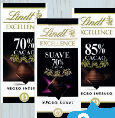
3,95 (€/100 g) CHOCOLATE Lindt Excellence, negro intenso 70% o 85% o suave 70 %, 100 g