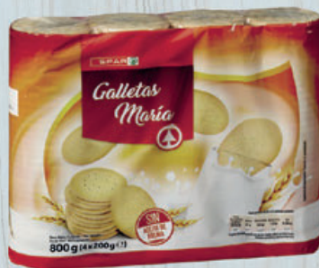
1,55 (0,39 €/ud.) GALLETAS MARÍA SPAR, 200 g, pack 4 ud.