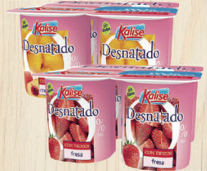
YOGUR DESNATADO CON TROZOS Kalise, melocotón, naranja y papaya, fresa o frutos del bosque, pack 4 ud.