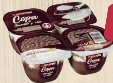
COPA SPAR, chocolate y nata, pack 4 ud

COMPRANDO 2 LA 2ª UD. SALE 1,33 (3,58 €/l) 2 unidades 3,98€ 1 ud. 2,65€ (7,16 €/l)