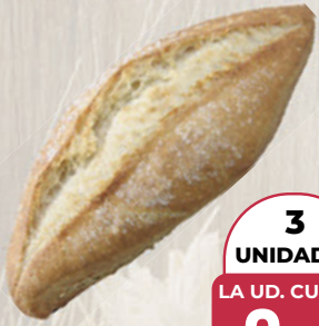
PAN GALLEGO 70 g

3 UNIDADES LA UD. CUESTA 0,36 (0,51 €/100 g) 3 unidades 1,09€ 1 ud. 0,49€ (0,70 €/100 g)