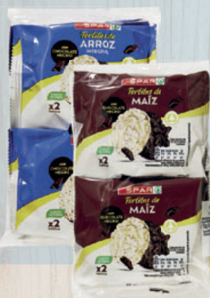
1,25 (0,63 €/ud.) TORTITAS SPAR, chocolate negro arroz o maíz, pack 2 ud.