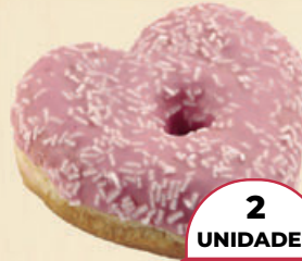
BOOGUIE CORAZÓN 52 g

2 UNIDADES LA UD. CUESTA 0,55 (0,65 €/100 g) 2 unidades 1,09€ 1 ud. 0,80€ (0,94 €/100 g)