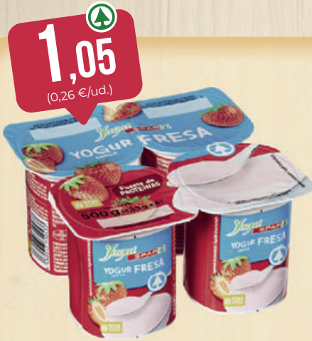
YOGUR YuguíSPAR, fresa, macedonia, limón o plátano, pack 4 ud.