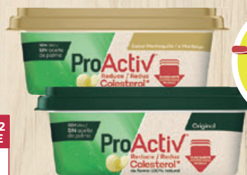
MARGARINA Proactiv Flora, original o sabor mantequilla, 225 g