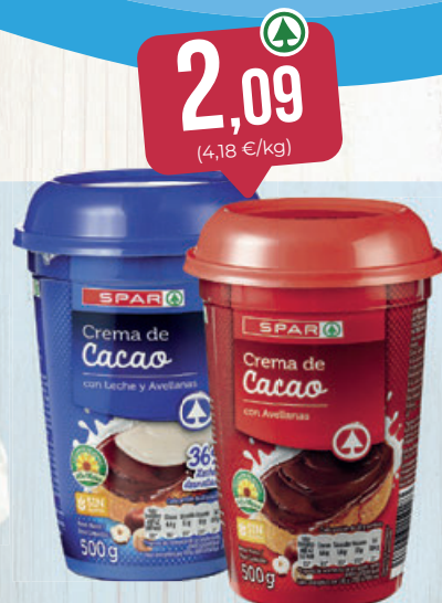
2,09 (4,18 €/kg) CREMA DE CACAO SPAR, con leche y avellanas o avellanas, 500 g