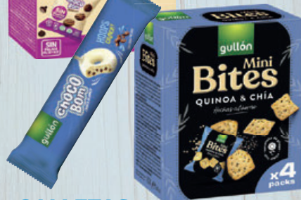
1 (0,78 - 0,63 €/100 g) GALLETAS Gullón, choco bom, bites salados, hoops leche o blanco, 128 - 160 g