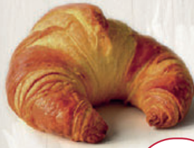
CROISSANT CURVO PLUS 85 g

3 UNIDADES LA UD. CUESTA 0,36 (0,51 €/100 g) 3 unidades 1,09€ 1 ud. 0,49€ (0,70 €/100 g)