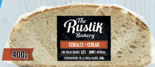
PAN The Rustik Bakery, multicereales, 400 g